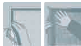
Selbstklebendes Befestigungs-Band anbringen. Fiberglas-Gewebe umschlagen und aufdrücken. Fertig!