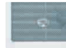
Fixierung des Rahmens am Lichtsacht-Rost mit 4 Stk. Spezial-Schrauben.